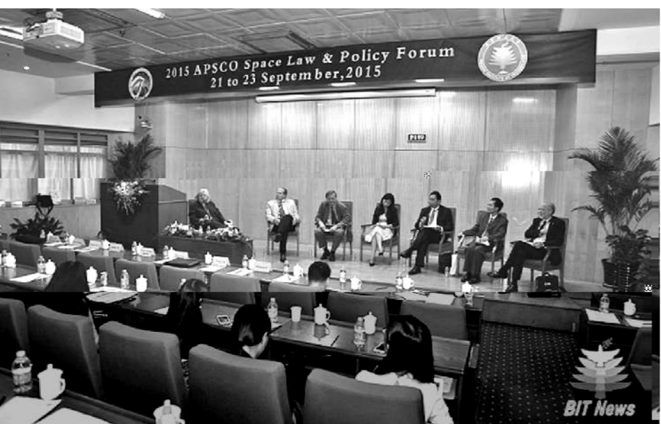
(文/法学院 乔续宁)

我校举办2015亚太空间合作组织法律与政策论坛。论坛吸引了来自世界各地的专家学者，共同探讨空间合作中的法律问题。会议气氛热烈，取得了圆满成功。