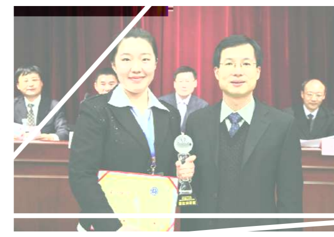
（文/党委/组织部 VWX）

在模拟法庭的实践中，学生不仅是参与者，更是学习者。他们在与对手的交锋中，汲取了宝贵的经验教训，实现了自我超越。 每一次庭审都是一次心灵的洗礼，每一次辩论都是一次智慧的碰撞。学生在不断的实践中，逐步树立了正确的法治观念和职业操守。 法学院将一如既往地秉承“弘道弘仁”的育人理念，努力培养具有家国情怀、社会责任感、创新精神的高素质法治人才。